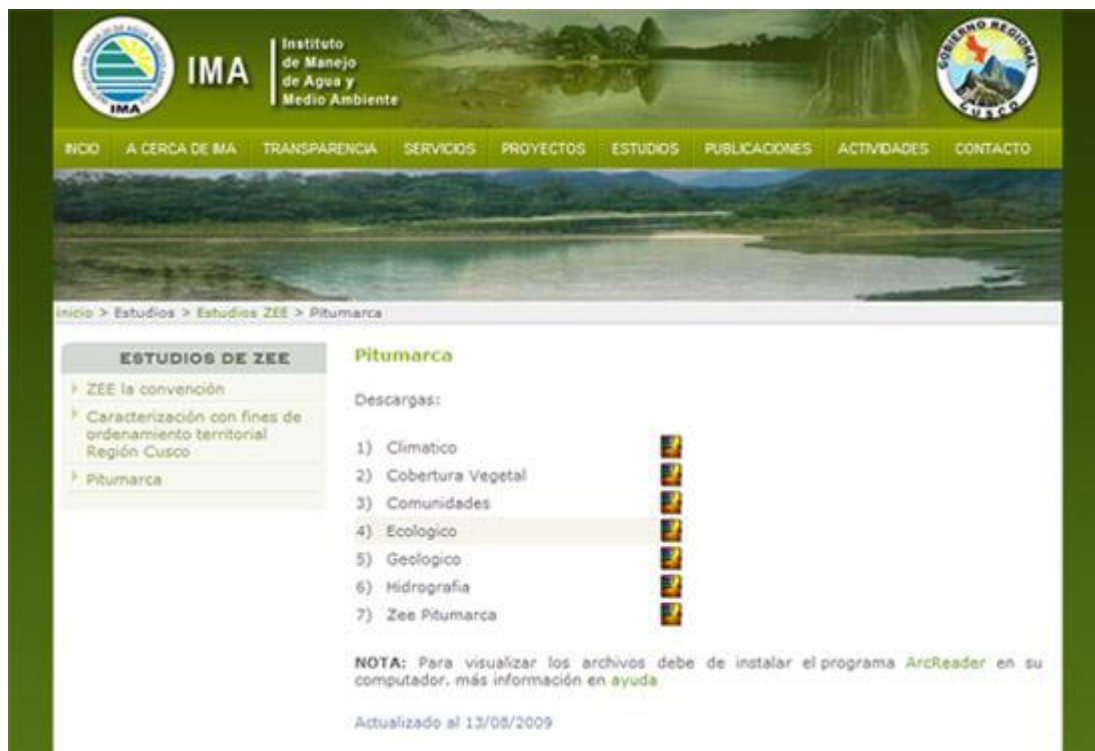
Figura Nro. 1: Entorno de la página web de proyectos GIS – IMA

Bienvenidos a la Pagina Web de publicaciones GIS de IMA, este documento le orientara en la utilización de la misma, la página tiene como objetivo mostrar al público en general los proyectos desarrollados por IMA. La página está diseñada para mostrar los proyectos con sus mapas y planos. Como se muestra en la figura Nro. 1, al lado izquierdo encontrará la lista de proyectos publicados y a la derecha el detalle de estos con una breve descripción del proyecto y en la parte inferior la lista de archivos o mapas a descargar, relacionados con el proyecto.